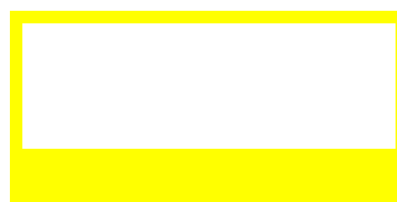
محل درج شناسه ها روی طرح جعبه (Artwork) یا طرح برچسب در صورت استفاده از برچسب